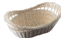
⑰ 籐製 パンカゴ