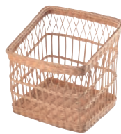
⑬ 籐製 フランスパンスタンド