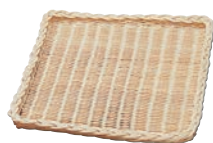
⑨ 籐 浅型かご