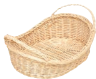
⑮ 籐製 耳付 舟型かご