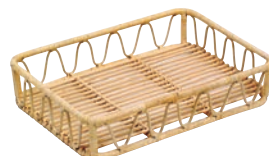
② 籐製 芯盛カゴ 角長深