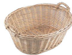
⑭ 柳製 耳付 小判カゴ