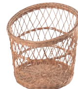
⑪ 籐製 フランスパンスタンド