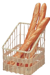
⑫ 籐製 フランスパンスタンド