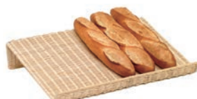
⑩ 籐製 フランスパンスタンド 横置浅型